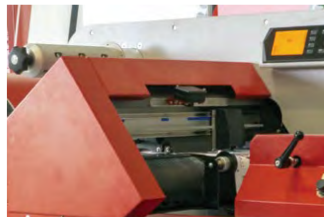
• Cámara de detección para proceso único que agiliza el corte.