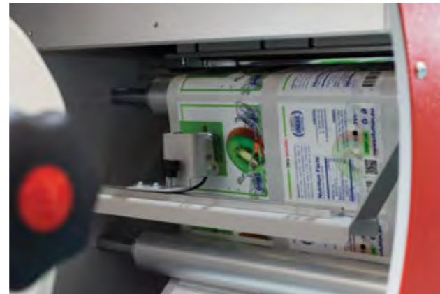
• Sensor lumínico de lectura