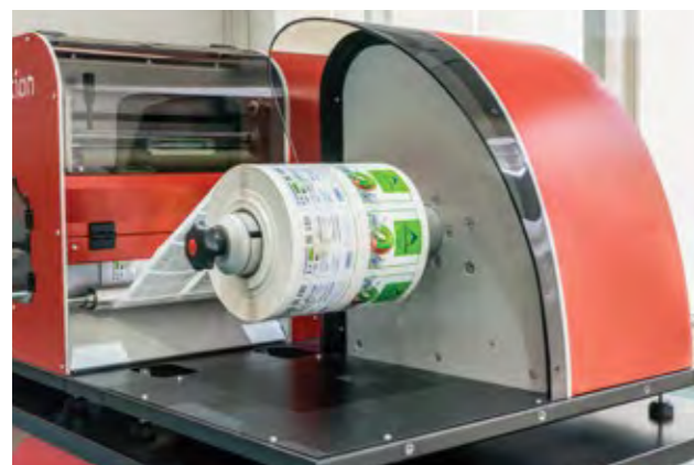
• Rebobinador de alta calidad