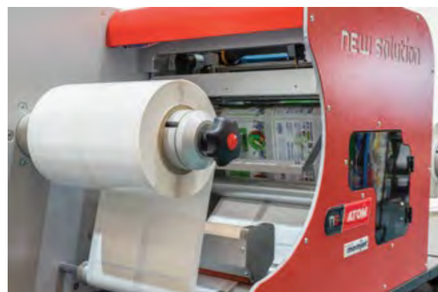
• Alimentador de rollos de hasta 300mm & limpiador de rollo que garantizan resultados consistentes.